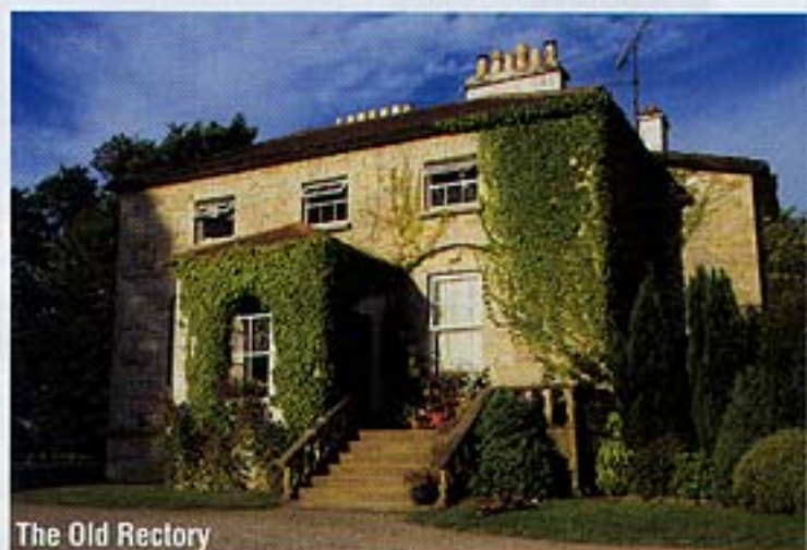
The Old Rectory