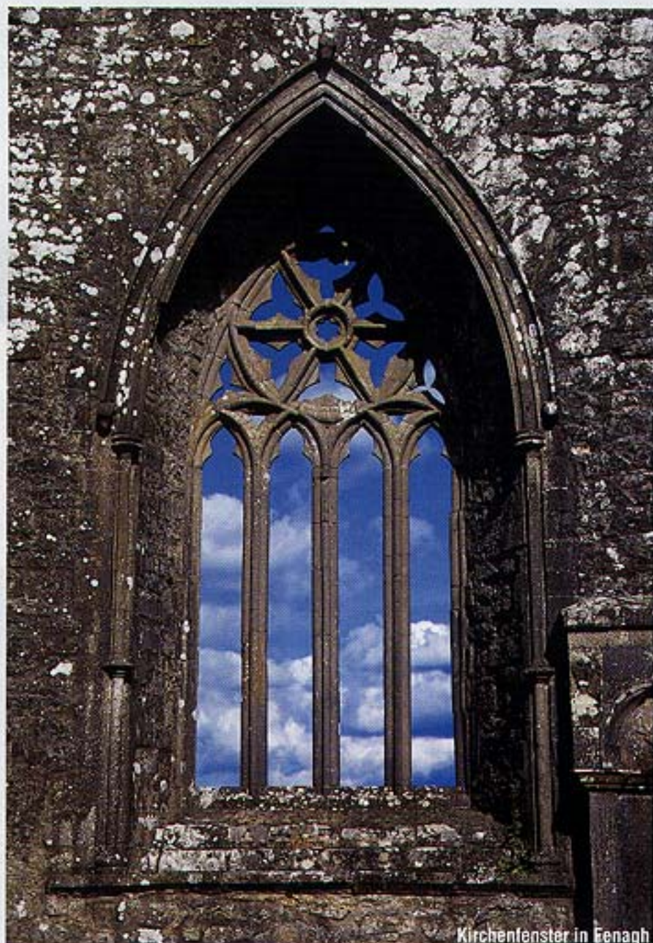
Kirchenfenster in Fenagh