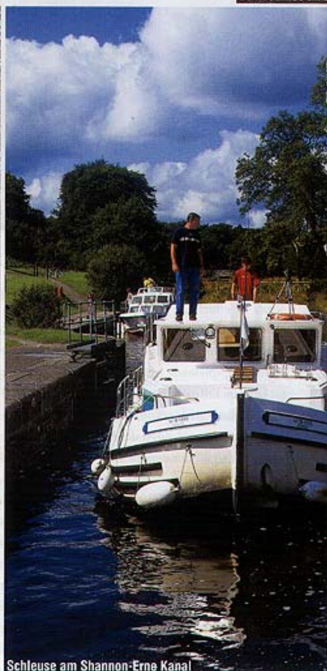
Schleuse am Shannon-Erne Kanal