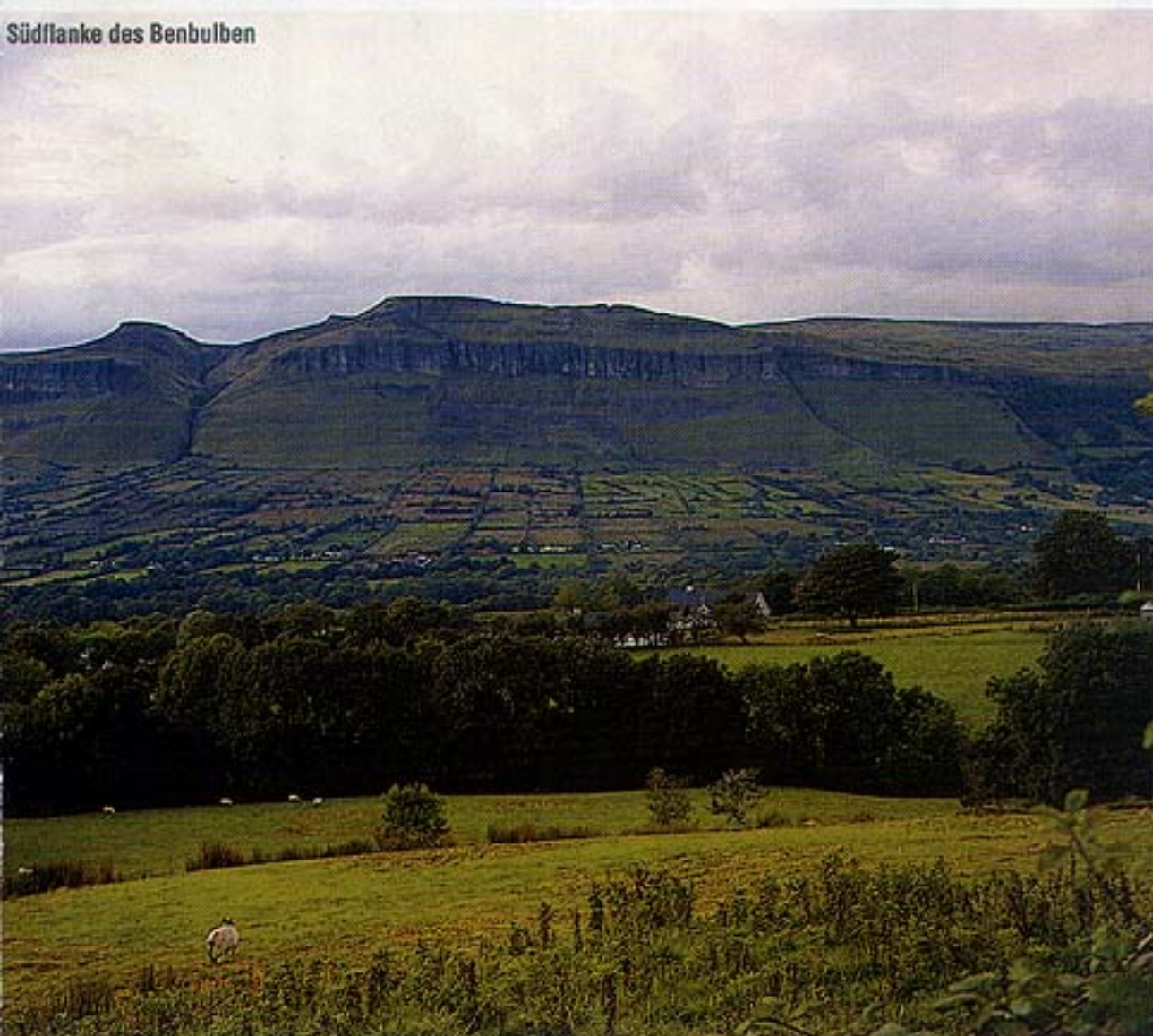
Südflanke des Benbulbin

Im Meereswind zergehen diese Gedanken vollends und wir stehen nur wenig später am Lissadell Strand in der Bucht von Drumcliff. Quicklebendig springen wir in die Fluten und genießen jeden Sonnenstrahl auf unserer Haut. Selbstzufrieden aalen wir uns danach im Sand und wollen nirgendwo anders sein als im Hier und Jetzt.